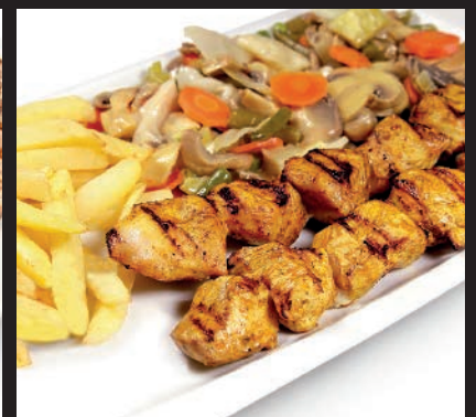
Dos Pinchitos de Pollo