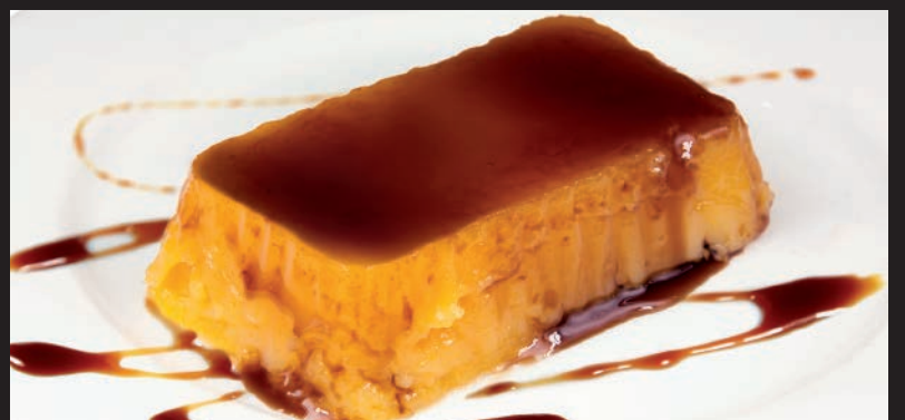
Tocino de Cielo Artesano

Tarta de Oreo A: 1 - 3 - 6 - 7 - 8 - 12 4,80 Oreo cake. Oreo-Kuchen.