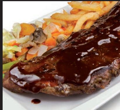
Costillar con Salsa Barbacoa

Chuletitas de Cordero A: 9-12 16,50 Lamb Chops. Lammkoteletten.