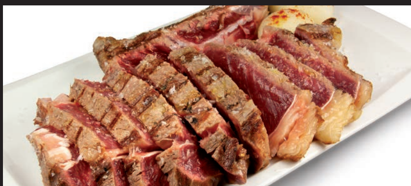
Chuletón de Ternera