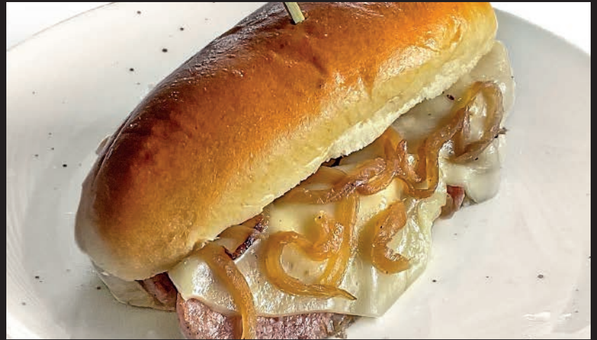
Perrito de Queso y Cebolla

Con patatas + 1€ / With french fries + 1€ / Mit kartoffeln + 1€