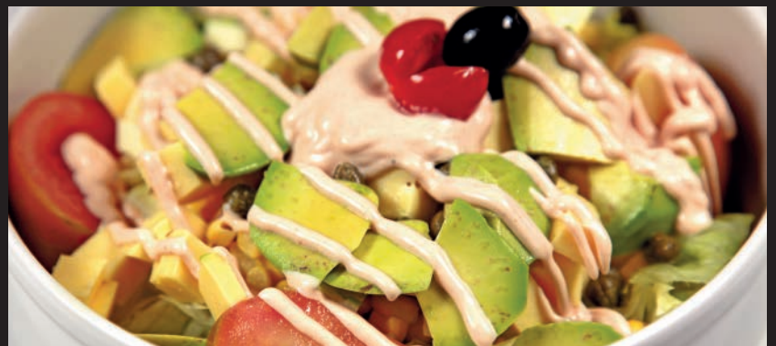
Ensalada de Queso