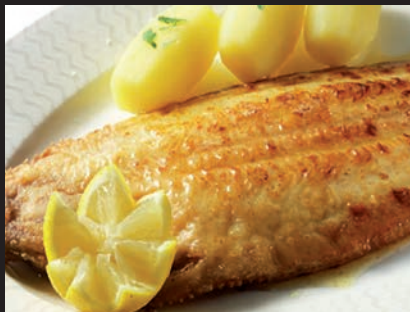
Lenguado a la Plancha