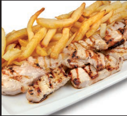
Filetitos de Lomo con Patatas