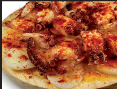
Pulpo a la gallega