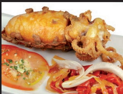
Choco Entero Frito