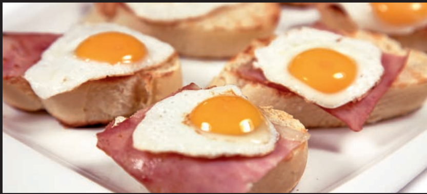
Huevos de Codorniz con Bacon