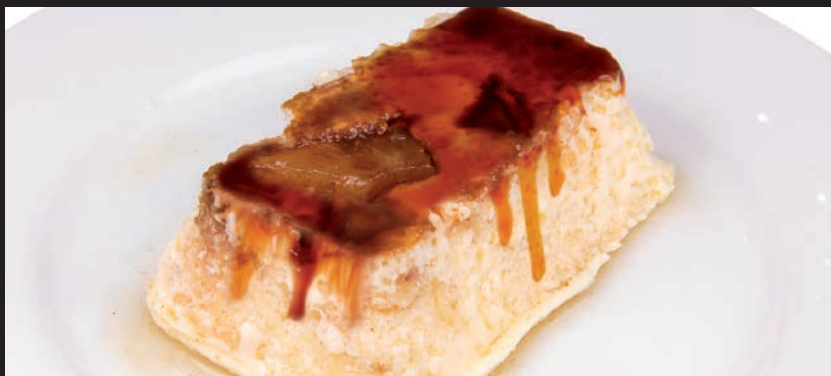
Pudin de Frutas