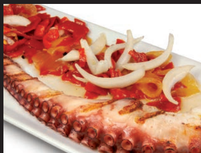
Pata de Pulpo Asada