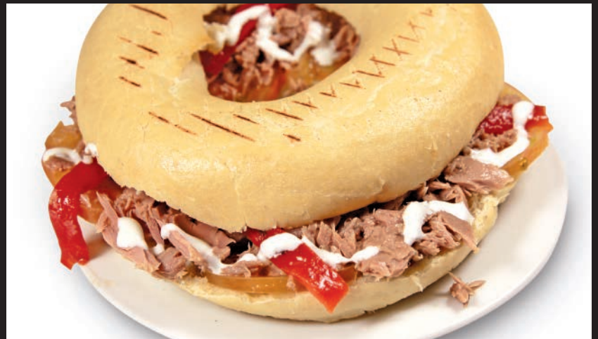
Rosca rellena de Ventresca de Atún