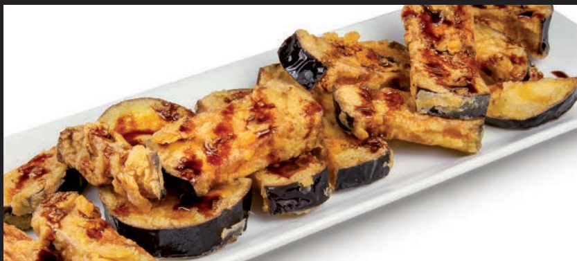
Berenjenas con Miel