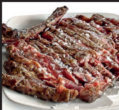
Chuletón de Vaca Frisona