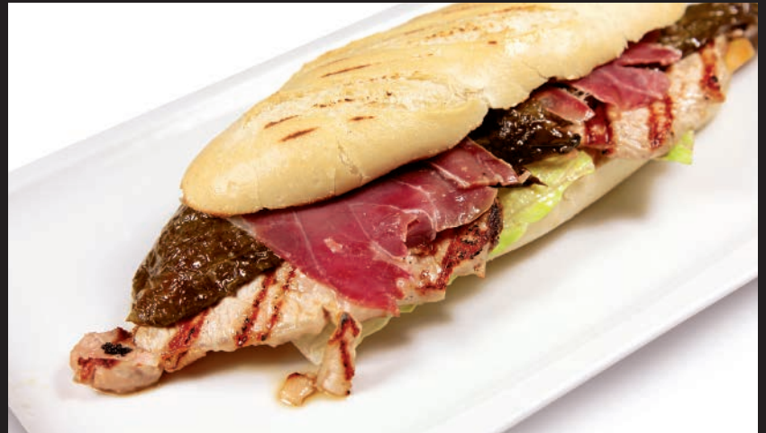
Serranito de Lomo con Jamón Serrano y Pimientos