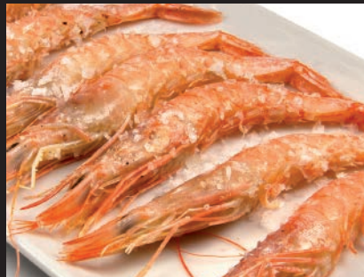
Gambas a la Plancha