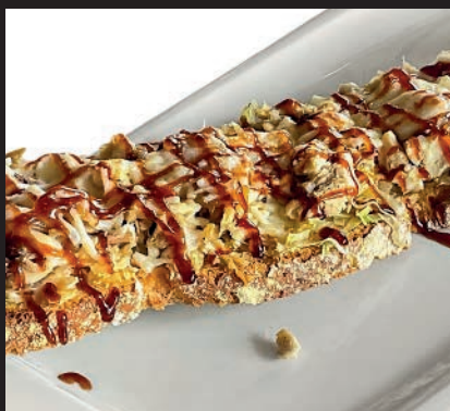
Tosta de Pollo Asado