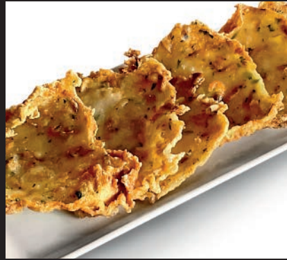
Tortilla de Camarón