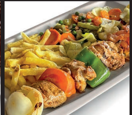
Brocheta de Solomillo de Cerdo