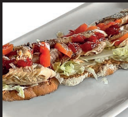
Tosta de Caballa