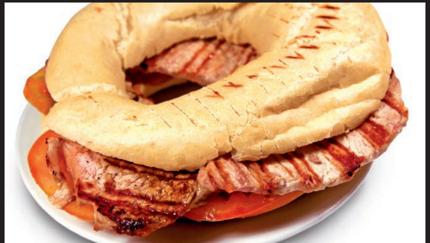
Rosca rellena de Lomo