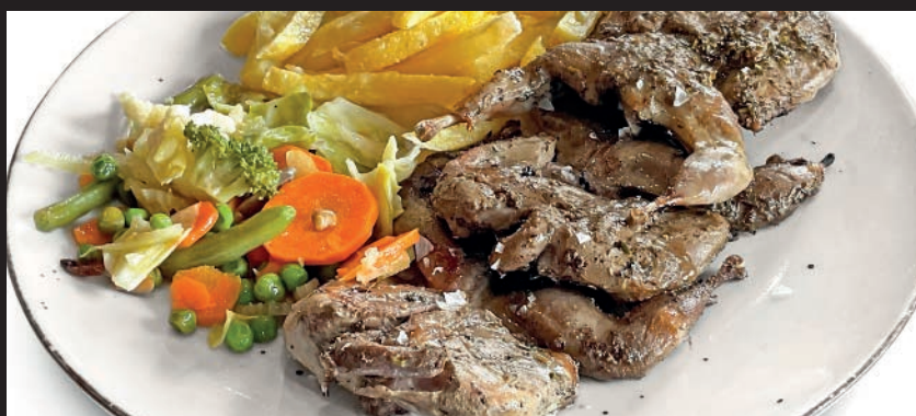
Codornices a la Brasa

Filetes de Ternera A: 9 - 12 11,90 Beef filet. Rinderfilet