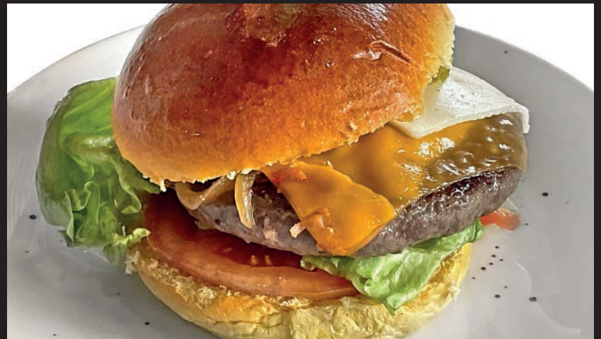
Hamburguesa de Angus