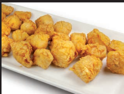
Tacos de Rosada Adobada