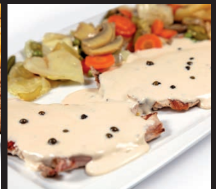
Lomo de Cerdo a la Pimienta Verde