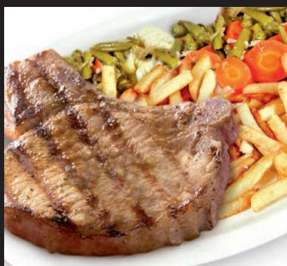
Chuleta de Cerdo