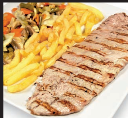
Solomillo de Cerdo