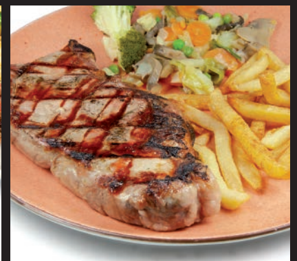
Entrecot de Ternera