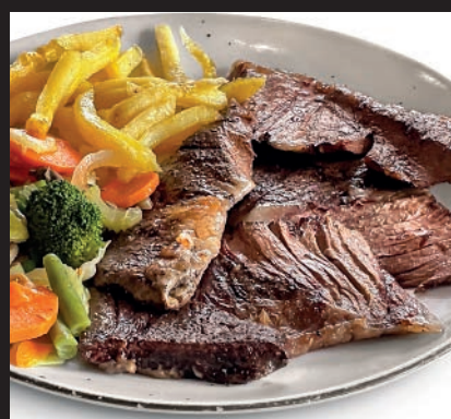
Entraña baja temperatura y parrilla