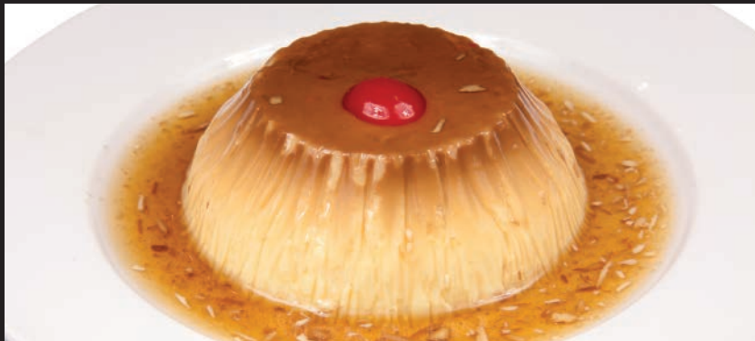
Flan de la casa