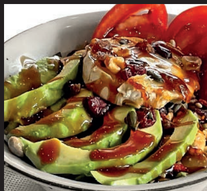
Ensalada de Rulo de Cabra