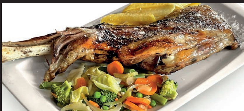
Paletilla de Cordero Lechal al horno