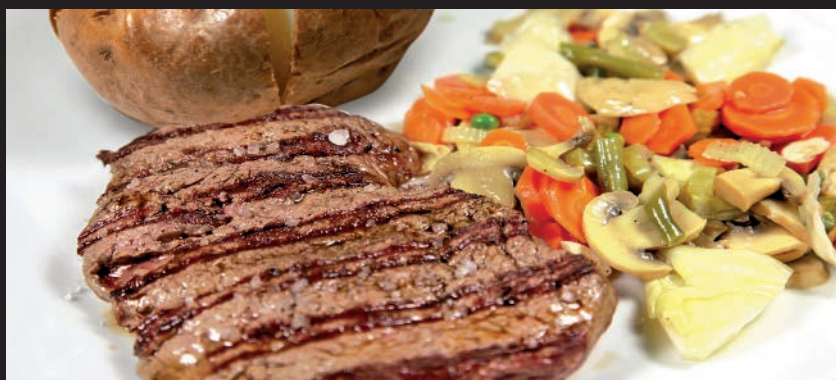
Solomillo de Ternera