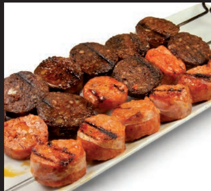
Chorizo y Morcilla