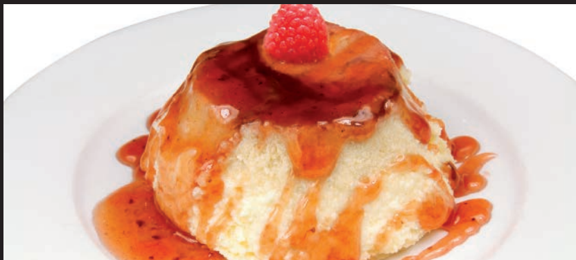
Tarta de Queso