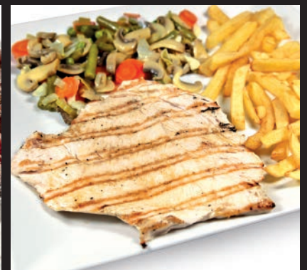
Pechuga de Pollo