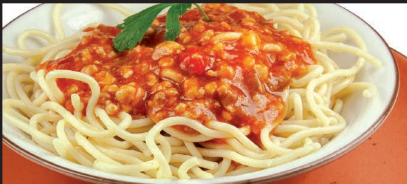
Spaghetti Bolognesa o Carbonara