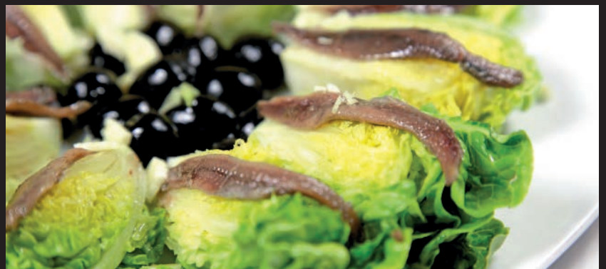
Cogollos con Anchoas