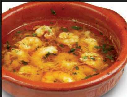
Gambas Pil Pil